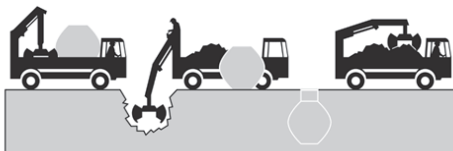
Haase kommt. Gräbt den Erdtank ein. Nimmt den Aushub mit. Fertig!

Selbst in hochwassergefährdeten Gebieten und bei hohem Grundwasserstand können Haase-Erdtanks eingelagert werden. In diesen Fällen wird der Tank mit einer kostengünstigen bauartzugehörigen Auftriebssicherung versehen.